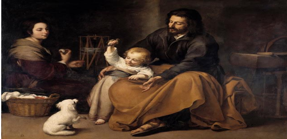
Sagrada familia del pajarito. Murillo