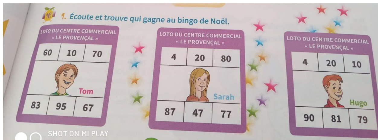
Ilustración 2 TAREA 2 ESCUCHAR EL AUDIO EN EL QUE ESCUCHARÁS LOS NÚMEROS DE UN BINGO. ADIVINA QUIÉN DE LOS TRES NIÑOS HA GANADO EL BI